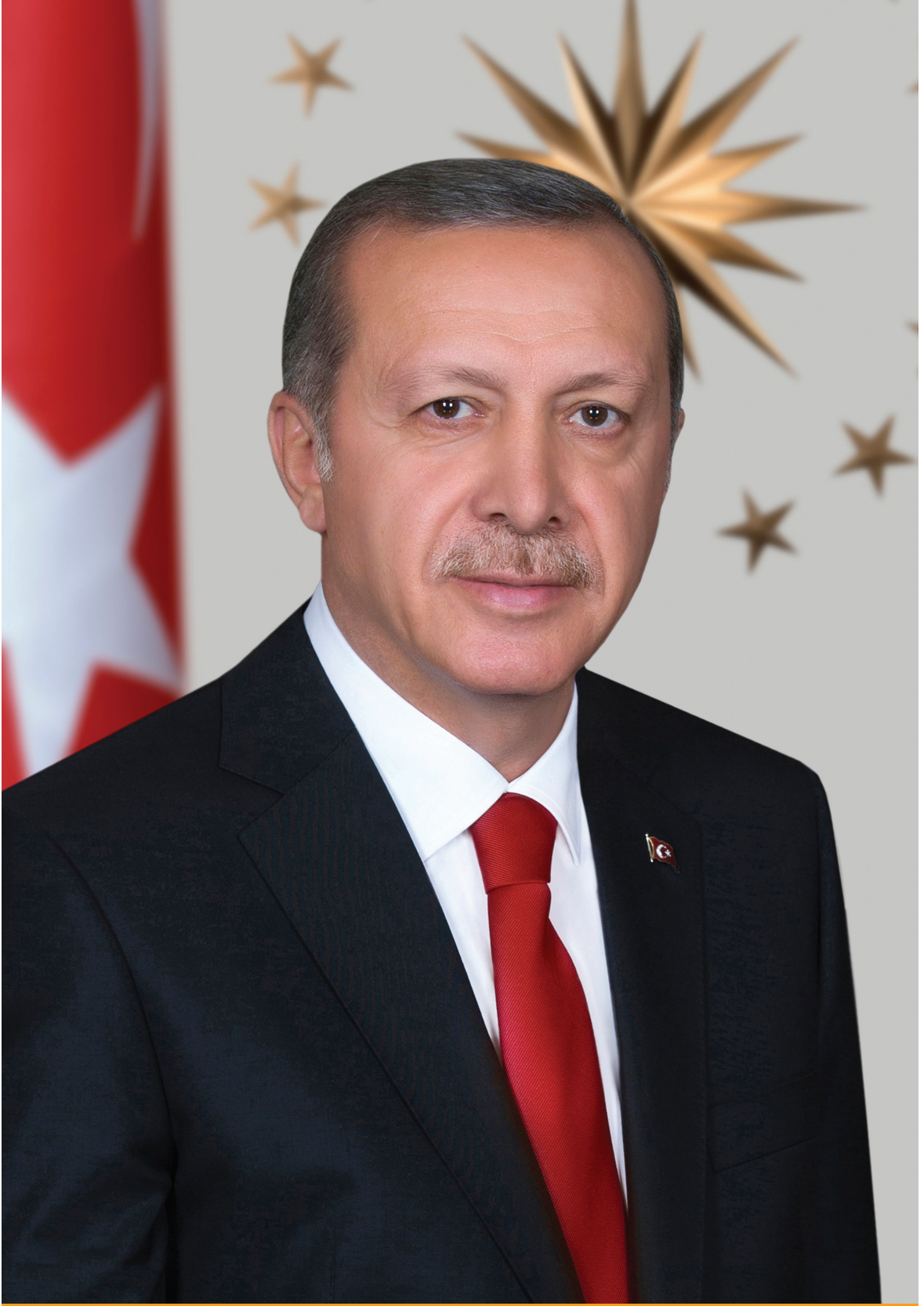
RECEP TAYYİP ERDOĞAN - 12.CUMHURBAŞKANI