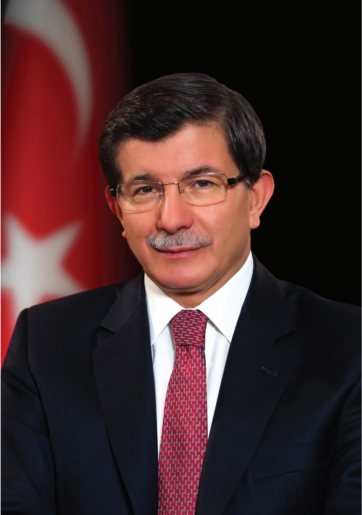
PROF. DR. AHMET DAVUTOĞLU - BAŞBAKAN